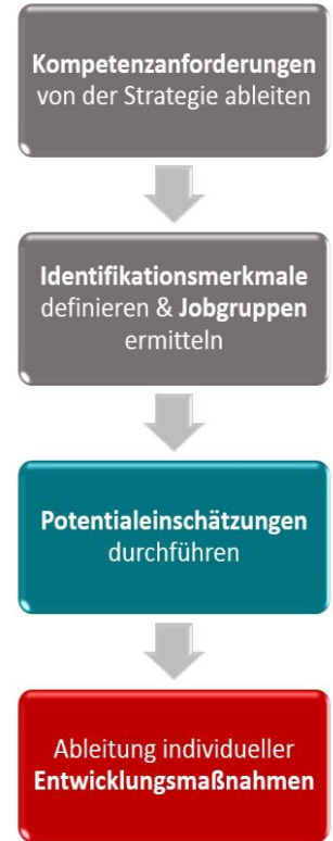
Das KODE ® X -Verfahren